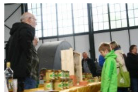
Info & Anschauungsmaterial